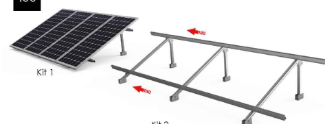
Kit 2 Montar estructura Kit 2 y unir a Kit 1