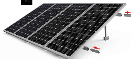
Kit 1 - Colocar las uniones (x2) suministradas el Kit de unión en el interior de los perfiles guía del Kit1