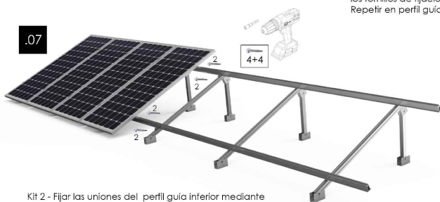
Kit 2 - Fijar las uniones del perfil guía inferior mediante los tornillos de fijación (2 a cada lado de la unión) Repetir en perfil guía superior.