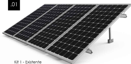
Kit 1 - Existente