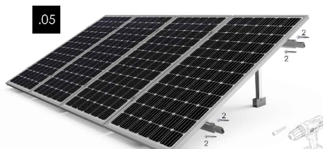
Kit 1 - Fijar las uniones del perfil guía inferior mediante los tornillos de fijación (2 a cada lado de la unión) Repetir en perfil guía superior.