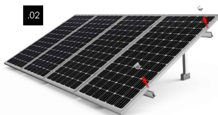
Kit 1 - Desmontar los presores laterales