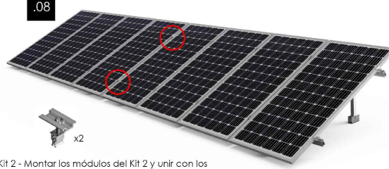
Kit 2 - Montar los módulos del Kit 2 y unir con los módulos existentes del Kit 1 con los presores centrales suministrados en el kit de unión. Montar los arriostramientos en ambos kits.